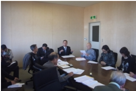
おおい町への申し入れ

広域避難については、両町とも、避難に自動車を使うことによる渋滞の問題、スクリーニングをどこで行うのか、その際の駐車場の確保、避難ルート等について何も決まっていなかった。