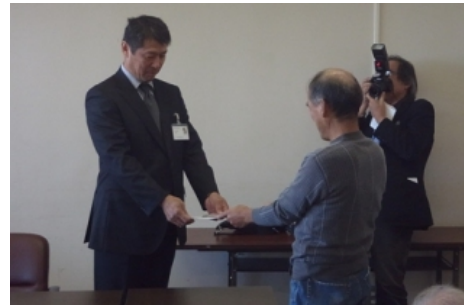
高浜町への申し入れ

避難計画など具体的に何も決まっていないこと、再稼働審査で炉心溶融を前提とした危険な事故シナリオが議論されていることが地元には知らされていないこと等が明らかになりました。再稼働は許してはならないと、改めて感じました。